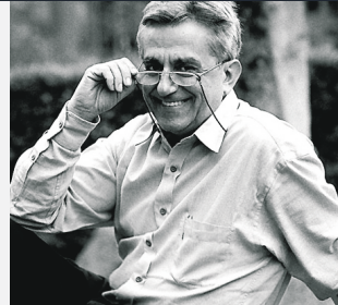
ANTONIO RODRÍGUEZ ALMODÓVAR

Premio Nacional de Literatura Infantil y Juvenil, 2005 Tercer Hermano Grimm.