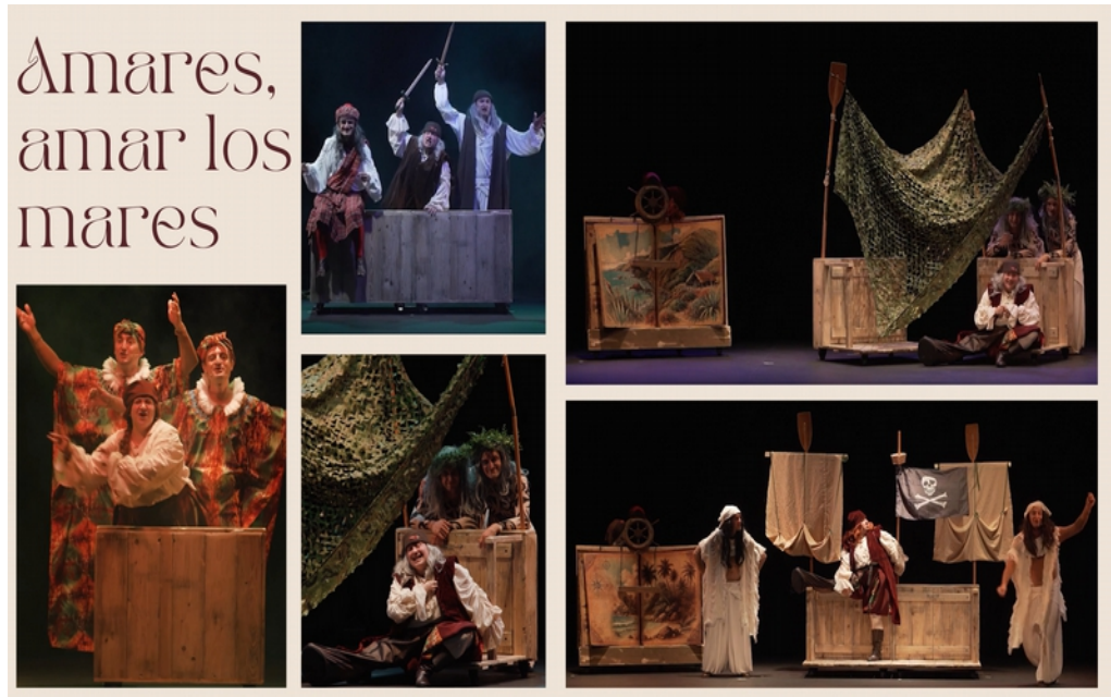
AMARES / ITSASMAITE PLANO ILUMINACIÓN - Espacio genérico