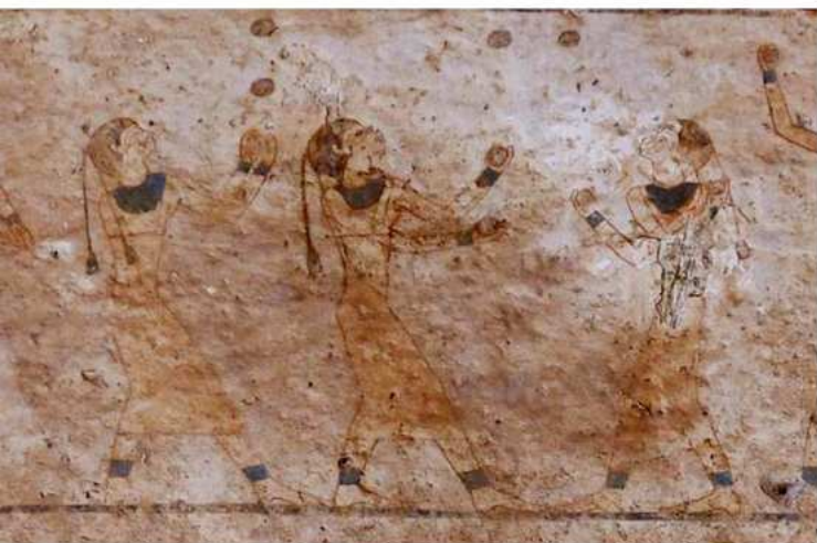
Malabaristas, fresco hallado en la tumba de Baqet III en Beni Hassan (Egipto)

Para sumergirnos en los orígenes del circo hay que remontarse a civilizaciones tan antiguas como la china, la mongola, la india, la griega, la romana o la egipcia. Todas ellas dejaron un legado en el que es posible encontrar ecos circenses (acrobacias, equilibrios, contorsiones...) asociados a celebraciones festivas, rituales religiosos o la preparación de guerreros para la batalla.